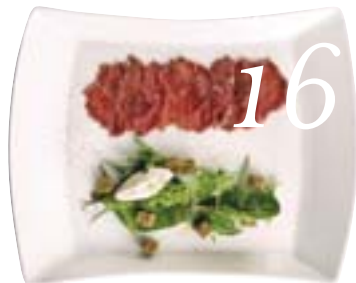
Inspireras av vilda och goda recept.