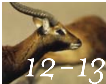
Smaka vilt från jordens alla hörn.