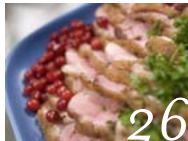
Få en godare jul med Polarica.